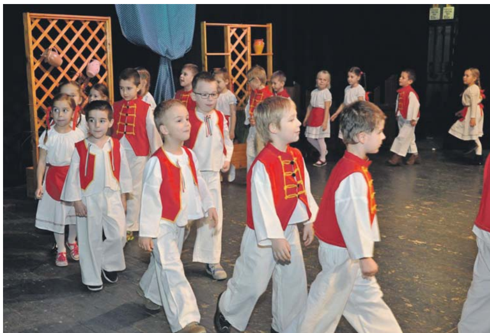
Osztatlan sikert aratott az Október utcai óvodások fellépése.

Aj na javisku sa vystriedali predstavitelia rôznych generácií. Pestrý program zahájili detičky z materskej školy na Októbrovej ulici a ukončili členky Ženského speváckeho súboru z Kartalu (Maďarsko). O výbornú atmosféru sa ďalej pričínili súbor Pántlika, Dunaág, Žitnoostrovský súbor ľudových tancov, spevokol z Dolného Štálu a súbor Cimborák.