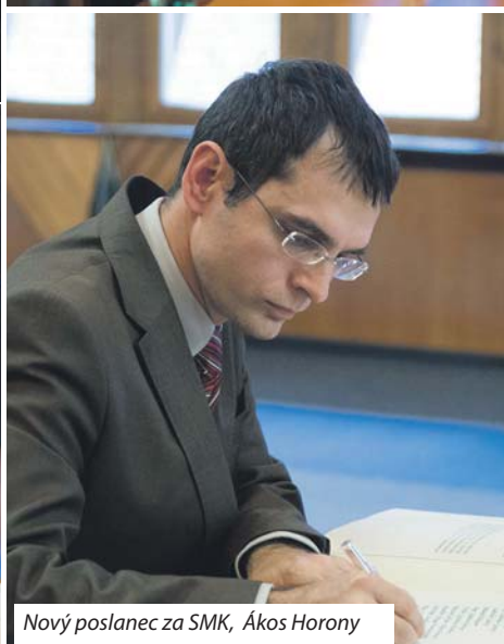
Nový poslanec za SMK, Ákos Horony