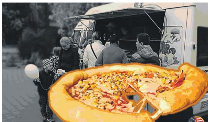
Pizza&Muffin ...épp az utcáiban