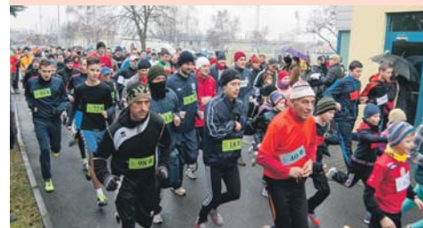
■ Szilveszteri futás 2014 Silvestrovský beh 2014