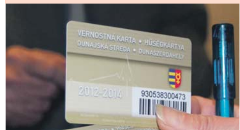
■ Az új 5-éves Húségkártyáról O novej 5-ročnej Vernostnej karte