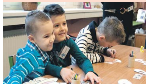
■ Az elsősök beiratásáról O zápisne prvákov