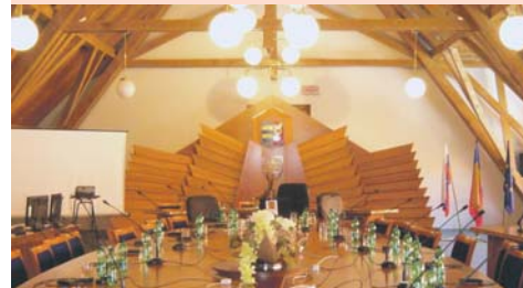
■ Városi költségvetés 2015 Mestský rozpočet 2015