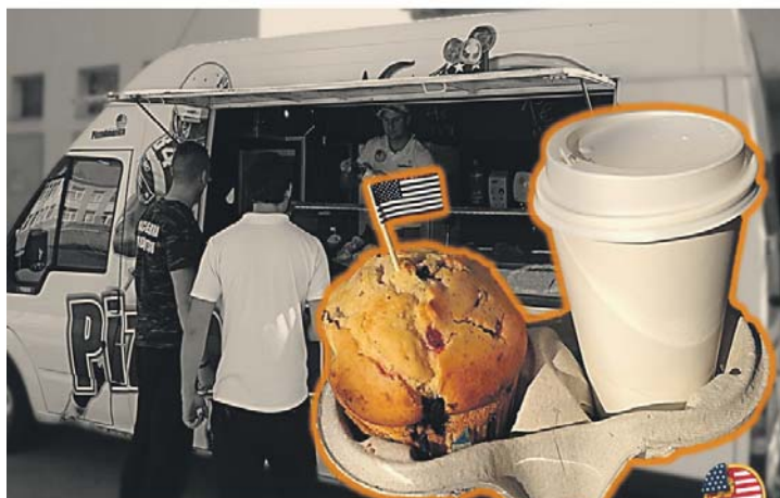
Muffin&Coffee ...épp az utcáiban

Dunaszerdahely utcáin megjelent egy újdonság: az Első Mozgó Pizzéria! Azok számára, akik épp a buszra, orvoshoz, iskolába, valamelyik hivatalba sietnek, vagy épp bevásárlás közben éheznek meg. Kiváló alapanyagokból kínál frissen, helyben sült pizza-különlegességeket, és tartósítószerrel nélkül a város legjobb muffinját. A PizzaAmerica mobil sütőde finomságait keresse a város forgalmas csomópontjain (pl.: Sládkovič utca, járási hivatal, bevásárló központok), vagy hívja akár házához (pl.: szülinapi ünnepekre, házi buli alkalmával): 0908 128 193 .