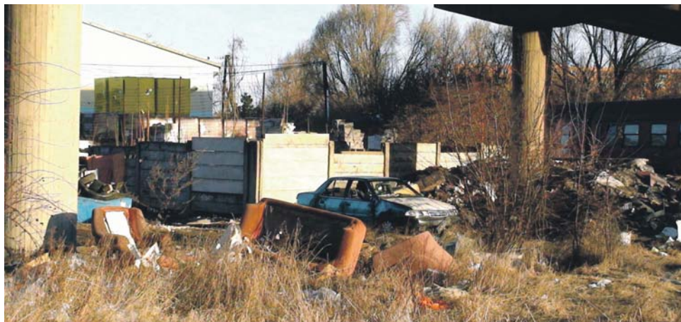
A felüljáró alatti limlomok között nem ritka az szétszerelt autórongs sem. / Medzi harambudami pod nadjazdom nezriedka vidno aj rozmontované vraky áut.

O parkovacie miesta pre taxislužbu sa môžu uchádzať podnikatelia, ktorých koncesia sa vzťahuje na Trnavský samosprávny kraj.