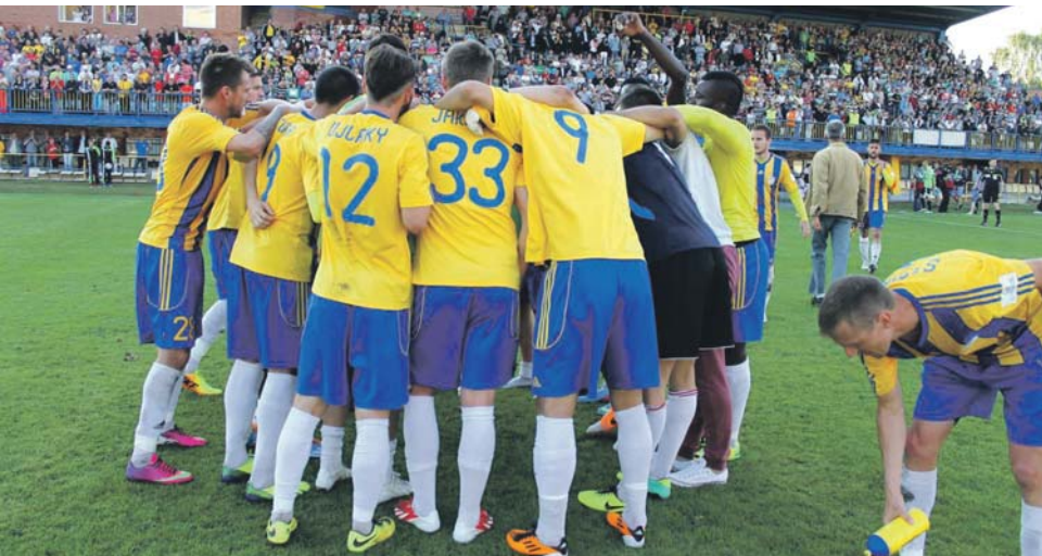
Örömmámor a DAC-stadionban: eldőlt, hogy a csapat megmenekült a kieséstől. / Nesmierna radosť na štadióne: DAC sa zachránil a pokračuje v najvyššej ligovej súťaži.