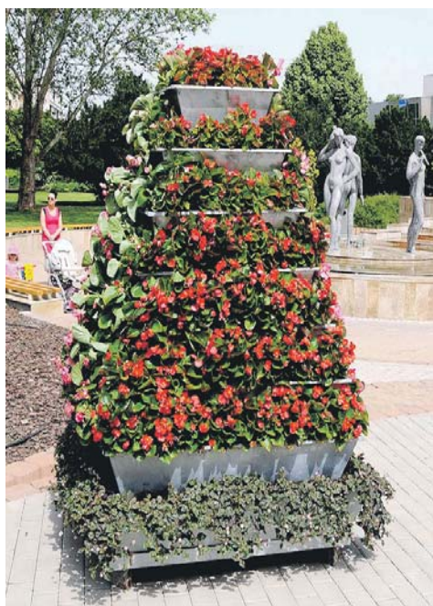
A Vámbery téren és a Bartók Béla sétányon múlt pénteken tetszetős virágpiramisokat helyeztek el. / Na Vámberyho námestí a na Korze Bélu Bartóka minúly piatok inštalovali vzhľadné kvetové piramídy.

Volili sme si 13 europoslancov, voliči do Bruselu posielajú Maroša Šefčoviča, Moniku Flašíkovú Beňovú, Borisa Zalu, Vladimíra Maňku (všetci Smer-SD), Annu Záborskú, Miroslava Mikolášika (obaja KDH), Ivana Štefanca, Eduarda Kukana (obaja SDKÚ-DS), Branislava Škripeka (OLaNO), Józsefa Nagya (Most-Híd), Richarda Sulíka (SaS), Pála Csákyho (SMK) a Janu Žitňanskú (Nova, KDS, OKS).