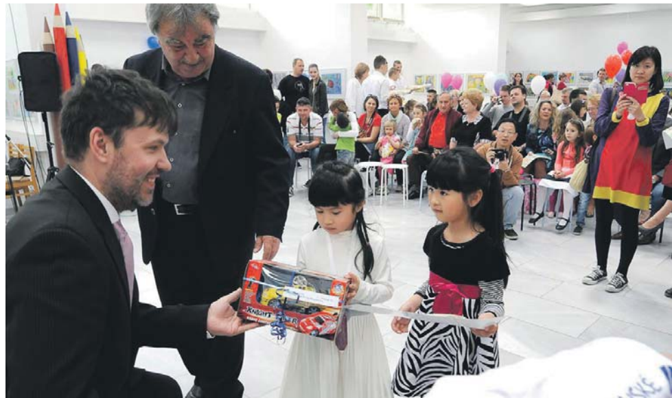
A messzi Hongkongból is eljöttek a díjazott kislányok és szüleik. / Aj z ďalekého Hongkongu pricestovali ocenené dievčatka v sprievode svojich rodičov.