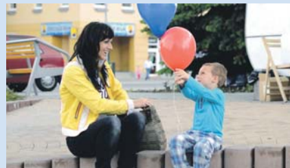
■ Városi Gyermeknap 2014 Mestský deň detí 2014