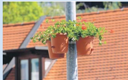
■ Virágok a belvárosban Kvety v centre mesta