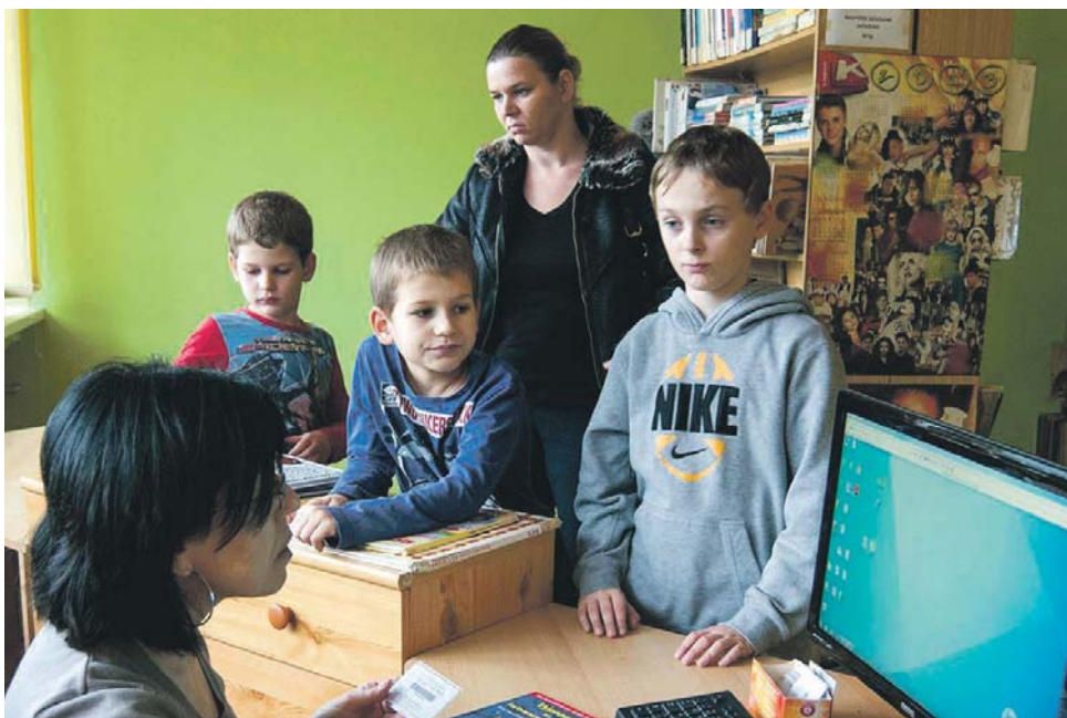
Obzvlášť veľkú pozornosť venujú mládeži, aby si obľúbila knihy a čítanie.