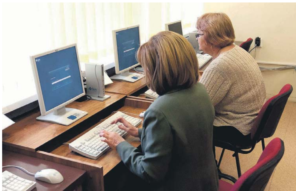
Nyolc számítógép áll a könyvtár látogatóinak rendelkezésére.