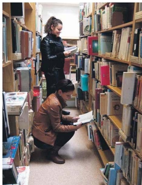
A lexikonok, enciklopédiák drágák, de a Csallóközi Könyvtárban nem sajnálják rájuk a pénzt.

De azért nem kell megijedni, nem csupa szakkönyvből és kötelező olvasmányból áll ez a nagyon hangulatosan berendezett könyvtár. Itt minden olvasót megbecsülnek, szeretettel várnak, azt is, aki a krimi, az útirajzokat vagy a szerelmes regényt kedveli, ezekből is nagy a választék. Sőt, az olyan lapokból is, mint például a Kiskegyed. “Minden igényt igyekszünk kielégíteni. A lényeg, hogy bevonzzuk az embereket. A köny-