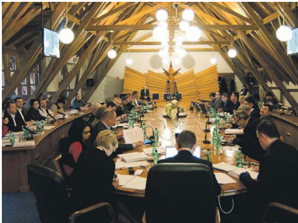
Archív-felvételünk a városi képviselő-testület tavalyi decemberi ülésén készült: akkor a jelenlévő 22 képviselőből mind a huszonketten egyhangúlag megszavazták Dunaszerdahely városának 2013-as költségvetését. Idén a december 10-én esedékes utolsó ülésen várható döntés a város 2014-es költségvetéséről.

A polgármester a továbbiakban arról szólt, milyen forrásokból kívánják fedezni a jövő évi beruházásokat. „A tőkekiadások terén jelentős beruházásokkal számolunk, ezek fedezetét egy 2.500.000,- eurós hitel biztosítaná. A hitelfelvétel javaslatában abból indultunk ki, hogy a város hitelállománya ne haladja meg a 45 %-ot, a megengedett felső határ egyébként 60 %.“ – mondta a polgármester. A másik fő szempont az volt, hogy a hitel törlesztése ne terhelje pluszkiadás-