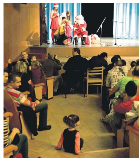
A VMK előcsarnokában ugyancsak vasárnap karácsonyi játszótér és Mikulás-ünnepséget tartottak. / Deti sa dobre zabávali na mikuláškovej slávnosti usporiadanej v Mestskom kultúrnom stredisku.

A dunaszerdahelyi városi önkormányzat a közzelgő karácsony jegyében tisztelettel meghív minden érdeklődőt a következő három vasárnapon esedékes ünnepélyes gyertyagyújtásra, a vásárra és a kísérőprogramokra is.