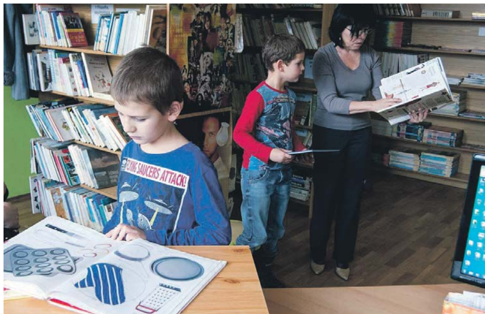
Zaobstarali maďarskú a slovenskú krásnu literatúru, diela klasikov ako aj súčasníkov, ktoré sú žiakmi vyhľadávané.

Knižnica dostala od mesta 300 eur na rôzne podujatia. Tieto peniaze majú svoje miesto, veď knižnica usporadúva ročne viac ako sto akcií v slovenskom a maďarskom jazyku, pre dospelých a pre deti. Obzvlášť veľkú pozornosť venujú mládeži, aby si obľúbila knihy a čítanie. Výstavy, kreatívne dielne, voľné diskusie, populárno-vedecké prednášky – to všetko je v programe knižnice, kde sa vždy niečo deje. Už aj preto sa oplatí zavítať do knižnice, ktorá sídli v Mestskom kultúrnom stredisku.