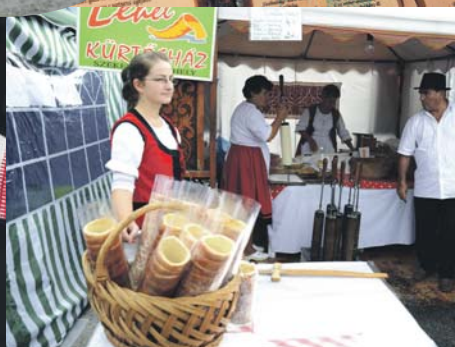
Testvérvárosunk, Székelyudvarhely standja is jelen volt az idei Csallókői Vásáron (alsó képek). / Aj stánok nášho družobného mesta Székelyudvarhely bol prítomný na tohtoročnom Žitnoostrovskom jarmoku (dolné fotky).