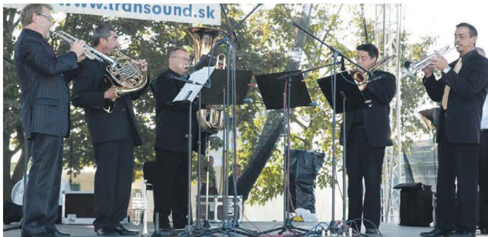
A győri filmharmonikusokból alakult alkalmi kamarazenekar az idei Csallóközi Vásáron is szerepelt egy bérletcsalogató koncerttel. / Členovia Filharmonického orchestra z Győru sa predstavili obecenstvu aj na tohtoročnom Žitnoostrovskom jarmoku.