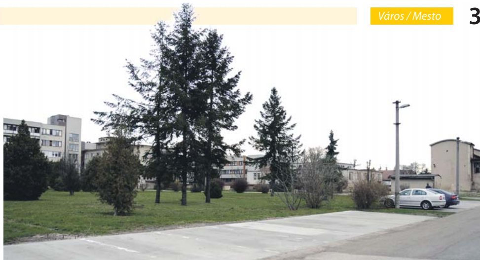
A Dunaszerdahelyi Kórház és Rendelőintézet vezetőségének jóváhagyásával a dunaszerdahelyi önkormányzat a Billa üzletközpont kivitelezőjével, a Badeco Kft-vel közösen új ingyenes parkolóhelyeket létesített a kórház udvarában, ezek azonban napközben rendszerint üresek. / So súhlasom vedenia Dunajskostredskej nemocnice a polikliniky vo dvore nemocnice zriadili bezplatné parkovisko v spolupráci mestskej samosprávy a spoločnosti Badeco, ktorá je realizátorom výstavby obchodného centra Billa. Cez deň však spomínané parkovisko väčšinou ziva prázdnotou.

Az első témát illetően az a fő kérdés, hogy a módosítandó rendeletben szereplő öt zónában mikor legyen a záróra. Vita tárgya az is, hogy mi számítson lakott és nem lakott övezetnek. A februári ülésen megjelent lakók a szórakozóhelyek közelsége miatt azt szorgalmazták, hogy a Rózsaligetben és az Északi lakótelepen 23 óránál tovább ne tarthassanak nyitva. A Galántai úti körforgalomnál lévő Prestige presszó pedig azzal elégedetlen, hogy a lakott területnek számító 5. zónába sorolták be, holott szerintük ez vállalkozási övezet. A város zónásítását és a nyitva tartás eszerint történő megállapítását még tavaly a járási ügyész javasolta, mert ha nem osztják övezetekre a várost, akkor mindenhol csak egységes lehet a nyitva tartás, tehát a záróra is.