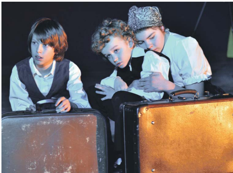
Gyerekek a kitelepítésről: nem egy nézőnek csalt könnyeket a szemébe az „Ez a vonat ha elindult” című irodalmi műsor, amelyet a VMK Novus Ortus diákszínpada, az alistáli Csip-Csirip Gyermekszínpad és a Dunaág Néptáncműhely tagjai adtak elő Takács Tímea rendezésében. / Dojemné predstavenie študentov o vysídlení Maďarov, v ktorom účinkovali členovia študentského divadelného súboru Novus Ortus a folklórnej skupiny Dunaág z Dunajskej Stredy a formácia Csip-Csirip z Dolného Štálu, réžia Tímea Takács. / Gyurcsó Photography/

A kétnapos rendezvény fő szervezője, a Magyar Megmaradásért PT április 20-án 17.00