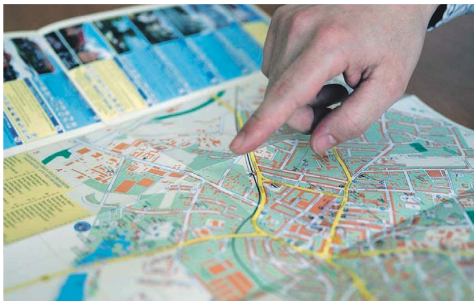
A városi termálfürdő első ízben jelentetett meg turistakalauzt közösen a dunaszerdahelyi szállásadókkal és vendéglátósokkal.

A medencefelújításról az igazgató elmondta: „Az időjárás kissé hátráltatta a munkákat. Amint az idő megengedi, megtörténik a medencetető kibetonozása, és a technológia kiépítése. Remélhetőleg az igazi szezon kezdetére, június elejére elkészülünk vele. A kinti részen május közepén kezdődik a szezon, addigra szeretnénk a medence kör-