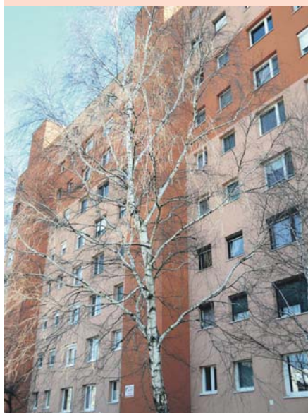
Ezt a terebélyes és veszélyessé vált fát is kivágják.

Pracuje sa aj na digitálnej mape cintorína, ktorá bude neskôr prístupná aj na webovej stránke mesta. Údaje bude zhotovujúca firma pravidelne aktualizovať.