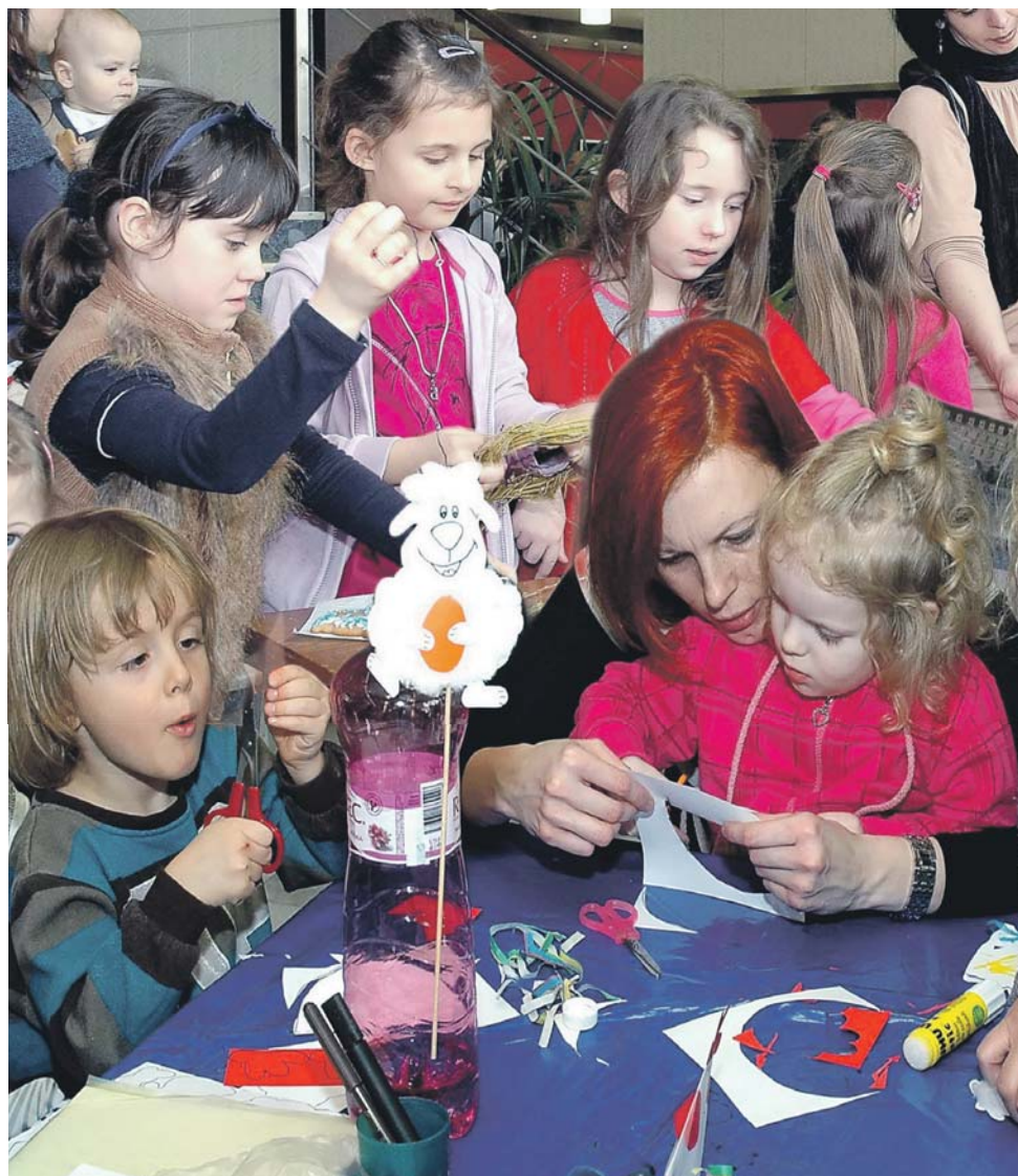
Húsvétváro játszóház. Velkonočný dom hier.

A városi önkormányzat nevében áldott, boldog húsvéti ünnepeket kíván minden dunaszerdahelyi lakosnak