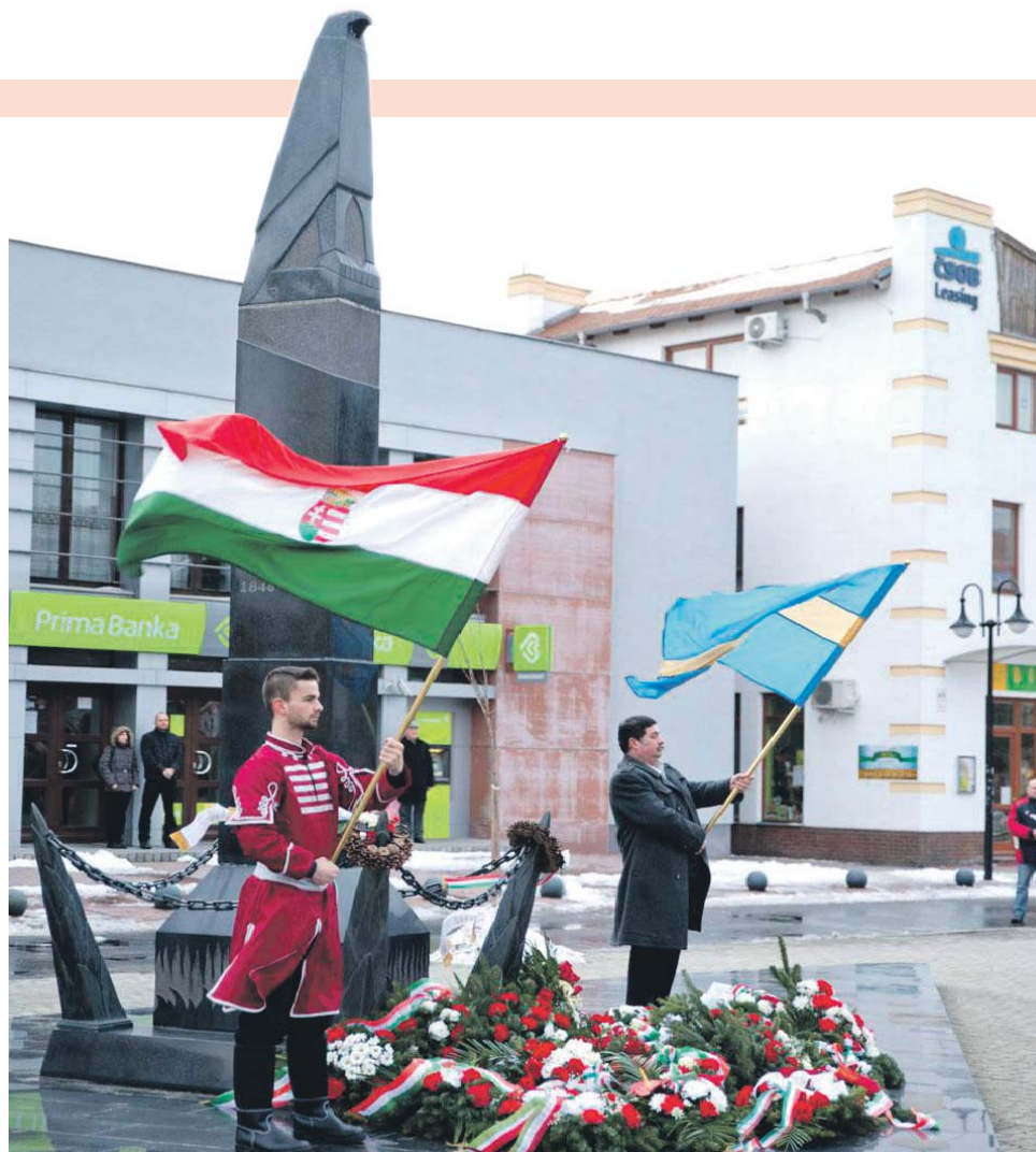
A székely zászló is szerepet kapott az ünnepségen.

A következő szónok Bugár Béla , a Most-Híd párt elnöke volt. Amikor megjelent a színpadon, az MKP jelen lévő városi képviselői, de a nézőteren ülők közül is többen kivonultak a teremből. Akadt, aki maradt, de tüntetően felállt és hátat fordított a szónoknak. Voltak, akik akkor távoztak, amikor Bugár a Most- Híd parlamenti munkájának eredményességéről beszélt. A közönség egy része a folyosón várta be a politikus beszédének végét. Bugár Kossuth és Széchenyi eltérő politikai elképzeléseire emlékeztetett, akiknek azonban csak az utat illetően volt eltérés az álláspontjuk, a célt tekintve nem, és megvalósításáért képesek voltak az együttműködésre. „ Tanulnunk kellene a viselkedésükből... Nekünk itt ma Szlovákiában a közös cél érdekében