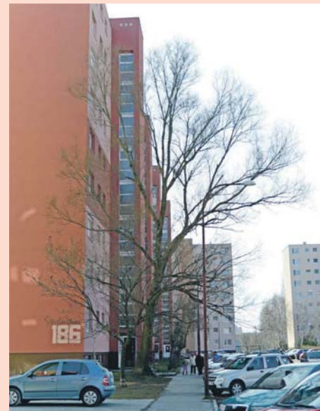
Tento rozvetvený a nebezpečný strom bude tiež vyrúbaný.

Občania mesta každoročne žiadajú výrub stromov z rôznych dôvodov. Niekedy pre clonenie satelitnej antény, či obyvateľky. Niekedy strom treba odstrániť, lebo sa nachádza práve nad inžinierskou sieťou, napr. vodovodom. Tento rok ide celkovo o 60 stromov, väčšinou sú to pajasene, brezy, borovice a topole, najmä na sídliskách. Ďalších 44 stromov čaká podobný osud pri autobusovej stanici z dôvodu prestavby budovy. V jednom prípade stromy odstránia preto, lebo znemožňujú montáž lešenia pri zateplení obytného domu.