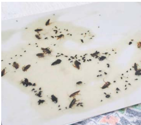
Svábov je všade neúrekom.