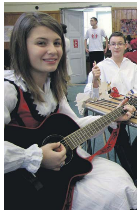
Pontok jártak táncért, hangszerért

fokára állhatott! Az ezüstérmes csapat egy 3 napos egri kirándulást kapott ajándékba, a győztesek pedig egy 4 napos erdélyi utat, torockói szálláshellyel. A szép sikerhez gratulálunk!