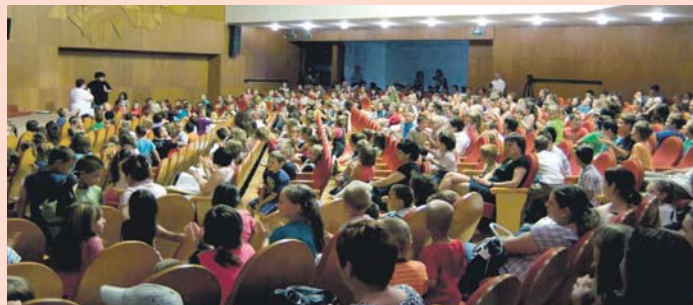
Dunaszerdahely költségvetéséből több, a Városi Művelődési Központban zajló rendezvényt is támogatnak egyszeri és vissza nem térítendő dotáció alakjában. / Z mestského rozpočtu vo forme jednorázovej a nenávratnej dotácie podporujú aj mnohé podujatia v Mestskom kultúrnom stredisku.

A támogatási kérelmek elbírálása. A Városi Hivatal illetékes osztálya folyamatosan bírálja el a beérkező kérelmeket, hogy összhangban vannak-e a fentebb felsorolt feltételekkel. A hiányos kérelmek nem kerülnek elbírálásra. Azokkal, akiknek a kérvényét jóváhagyták, Dunaszerdahely városa az érvényes általánosan kötelező érvényű rendeletnek megfelelően szerződést köt a dotáció folyósításáról.